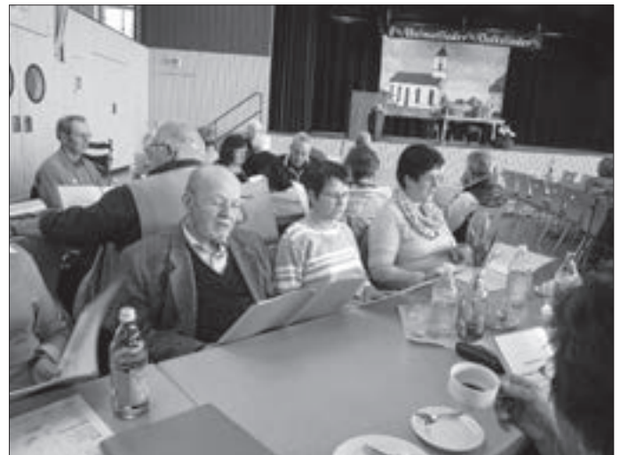
Text und Bild: Edda Hahn

Es war ein schöner Nachmittag und wir versprachen uns gegenseitig, uns bald wieder beim Volkslieder singen zu treffen.