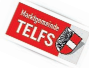
Roland Tibi Bürgermeister

Wir freuen uns auf Ihre Teilnahme. STADTVERWALTUNG ELZACH