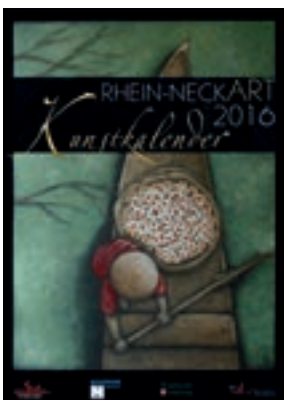
Titelseiten der Kunstkalender aus den Jahren 2012, 2014 und 2016