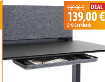
Schwarzwald-Lab Filzschublade - Tuck away