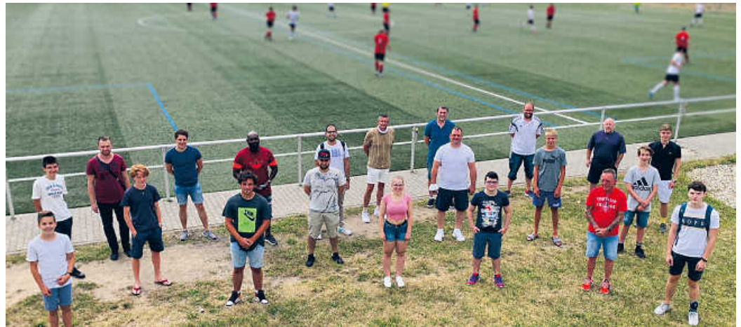
Insgesamt 20 Frauen und Männer haben sich für den Lehrgang angemeldet.