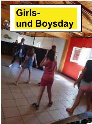
Girls- und Boysday

Das Jugendhaus befindet sich zwar gerade noch mitten in der Renovierung, trotzdem hat der Verein für die Jugend dieses Jahr insgesamt drei Ferienspielaktionen angeboten. Nach jeweils einem Nachmittag für Mädchen und Jungs war das dritte Angebot dann für alle Kinder von 10-14 Jahren offen. Es wurde gespielt, getanzt und das heiße Wetter natürlich auch für die eine oder andere Wasserschlacht genutzt. Wenn die Renovierung abgeschlossen ist, soll es nach den Sommerferien auch regelmäßig offene Gruppentreffs im Jugendhaus geben.