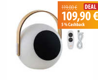
moonii moonii Eye Speaker