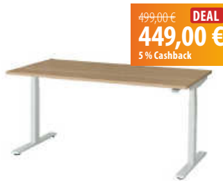
Schwarzwald-Lab Electio Smart Sitz-Steh-Schreibtisch

Stelle dir deinen individuellen Arbeitsplatz für mehr Wohlfühlatmosphäre zusammen. Größten Wert wird auf hochwertige und nachhaltige Materialien sowie ökologisch bewusste, regionale Herstellungsprozesse gelegt. Stöbere gerne in den Produkten und erfreue dich an den innovativen Lösungen für deinen Arbeitsplatz.