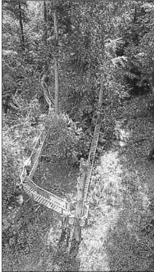
Es gab vieles zu entdecken im Baum- kronenweg

„Große und kleine Abenteuerfans aufgepasst! Deutschlands Süden ist überraschend wild: Dunkle Wälder, rauschende Schluchten und verwunschene Auen zeigen die Natur von ihrer ursprünglichen Seite. Wer sich in Baden-Württemberg auf eine Expedition begibt, findet abwechslungsreiche Landschaften und ein breites Angebot an Familienangeboten vom Naturerlebnispfad bis zum Freizeitpark mit Erlebnis-Camp.“ Das war das Motto einer Pressereise, die von der Tourismus Marketing Gesellschaft Baden-Württemberg (TMBW) für Journalisten aus Österreich ausgeschrieben wurde. Das ZweiTälerLand (ZTL) war Teil davon.