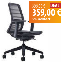
Schwarzwald-Lab Bürostuhl Tonique - Der Vollautomat