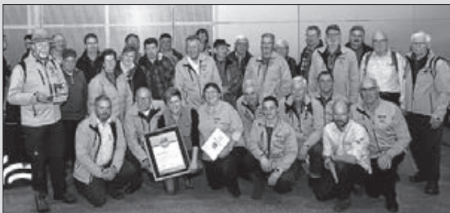
Ehrenamtliche Helfer

Weitere Infos unter www.zweitaelersteig.de .