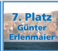
7. Platz Günter Erlenmaier