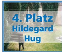
4. Platz Hildegard Hug