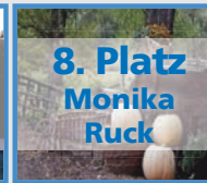
8. Platz Monika Ruck