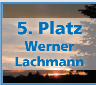
5. Platz Werner Lachmann