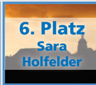
6. Platz Sara Holfelder