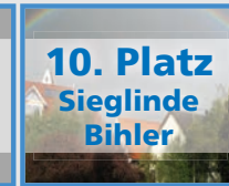
10. Platz Sieglinde Bihler