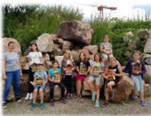
Wir bauen ein Insektenhotel

Viel Spaß und Freude haben unsere Kinder beim diesjährigen Ferienprogramm. Auch dieses Jahr ist für jedes Kind was passendes dabei ☺