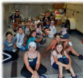
Spielerische Einblick in das DRK