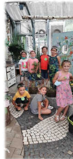
Blütenspaß in der Gärtnerei