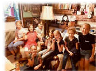
Wir fertigen eine Halskette