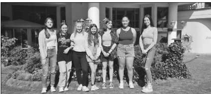
Schülerinnen bei der Besichtigung des Elztalhotel in Winden

Im Juli 2017 war es endlich wieder so weit. Die Schulen durften wieder Praktika als auch Betriebserkundungen durchführen. So war es nach der Notenvergabe möglich, einigen Schülern Einblicke in die Gastronomieberufe als auch Berufe in der Landwirtschaft zu ermöglichen. Im Rahmen des Projekts "Ausbildungslotse" besuchten an 2 Terminen insgesamt 18 interessierte Neuntklässler/innen der Realschule Elzach das Elztalhotel in Winden. Die Schüler/innen wurden an der Rezeption freundlich in Empfang genommen. Fr. Tischer, die Inhaberin, führte die Schülerinnen durch den großen Gebäudekomplex des Elztalhotels. Dank der ausführlichen Führung erhielten die Schüler/innen einen sehr guten Einblick in die verschiedenen Gastroberufe und die damit verbundenen Aufgaben. Die Schüler/innen waren sichtlich beeindruckt von den vielfältigen Angeboten, die das Elztalhotel anbietet, und die Möglichkeiten, welche Berufe die Gastronomie bereithält.