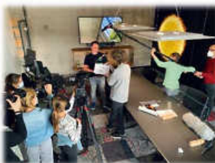
Elzach's coolster Film