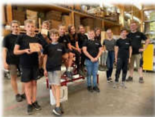
zu Besuch beim Schreiner

Auch die weiteren Angebote machen Euch bestimmt viel Spaß!