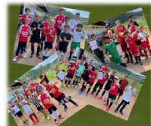
Rund um den Ball