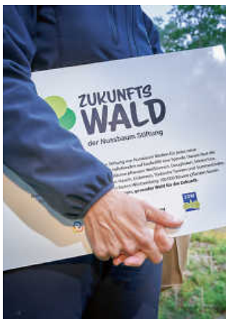
In Eppingen entsteht dank des Engagements der Nussbaum Stiftung ein nachhaltiger „Zukunftswald“.