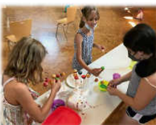
Let's bake Cake Pops