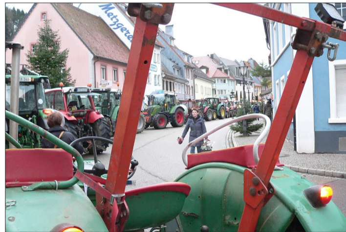
Zahlreiche Traktoren verwandelten Elzachs Hauptstraße kurzfristig in eine Fußgängerzone.

Fechner stellt klar, dass auch er mit den Vorschlägen zulasten der Landwirtschaft nicht einverstanden ist. „Eure Anliegen sind berechtigt“, die geplanten Kürzungen müssten zurück genommen werden. Statt dessen sollte ein Kompromissvorschlag, wie ihn die Bauernvertreter bereits ausgearbeitet haben, diskutiert werden. Er werde sich im Deutschen Bundestag dafür einsetzen, die Kürzungen im Agrarbereich zurück zu nehmen, um auch weiterhin regional erzeugten Nahrungsmitteln eine Chance zu geben.