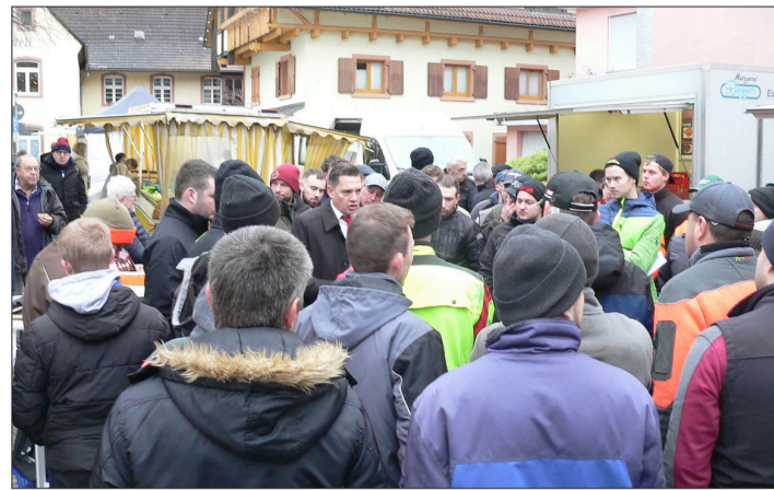
Land- und Forstwirte sprechen in Elzach mit dem Bundestagsabgeordneten Johannes Fechner.

Elzach (db). Publikumsmagnet war Ende April 2023 das neue Rettungszentrum in Elzachs Südstadt. Tausende von Besuchern kamen zum Tag der offenen Tür, um das neue gemeinsame Domizil der Rettungswache des DRK-Kreisverbandes Emmendingen und der Freiwilligen Feuerwehr in Augenschein zu nehmen. Einhelliges Fazit: „Toll hier, da ist echt was Gutes gemacht worden“. Im Mittelpunkt des Interesses stand der Einsatzleitwagen des DRK-Kreisverbandes Emmendingen. Eine fahrbare Leitstelle, vollgepackt mit Computertechnik und Logistikmaterial. An allen Verpflegungsständen herrschte Großandrang. Ein denkwürdiger Tag für die „Blaulicht-Familie“ im Landkreis sowie im Elztal.