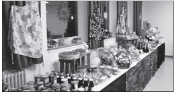
Adventsbasar Johanneskirche Elzach

Herzlich danken wir allen, die dazu beigetragen haben, dass der Adventsbasar gelingen konnte!