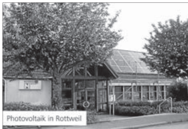
Photovoltaik in Rottweil