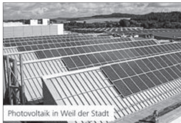
Photovoltaik in Weil der Stadt

Deshalb ließ Brigitte Nussbaum im Sommer 2011 auf den Dächern der Betriebe Weil der Stadt, Rottweil und Uhingen sowie der Außenstelle Dußlingen Photovoltaikanlagen aus deutscher Herstellung installieren. Die Anlagen produzieren zusammen rund 181.000 Kilowattstunden jährlich, was dem durchschnittlichen Stromverbrauch von 40 Einfamilienhäusern entspricht. Zudem wird der Ausstoß von Kohlendioxid um jährlich etwa 14 Tonnen verringert.