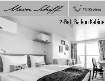
2-Bett Balkon Kabine