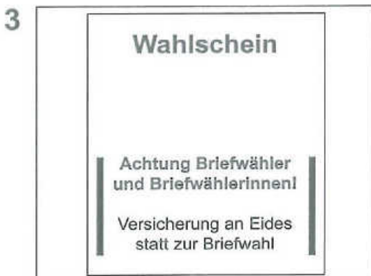
„Versicherung an Eides statt zur Briefwahl“ in der unteren Hälfte des Wahlscheins mit Datumsangabe unterschreiben.