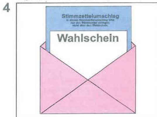
Wahlschein zusammen mit dem blauen Stimmzettelumschlag in den hellroten Wahlbriefumschlag stecken.