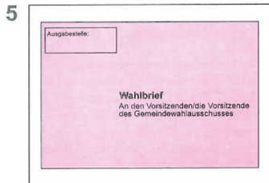
Hellroten Wahlbriefumschlag zukleben, zur Post geben oder bei der auf dem Wahlbriefumschlag angegebenen Stelle abgeben.

Beachten Sie bitte, dass der Stimmzettel unbeobachtet zu kennzeichnen und in den blauen Stimmzettelumschlag zu legen ist.