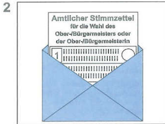
Stimmzettel in den amtlichen blauen Stimmzettelumschlag legen und zukleben. (Der blaue Stimmzettelumschlag kommt später ungeöffnet in die Wahlurne.)