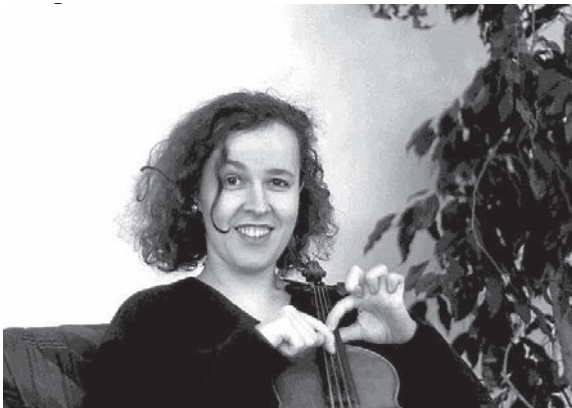
Text siehe evangelische Kirche

Geigenkonzert in der evangelischen Jahanniskirche Elzach