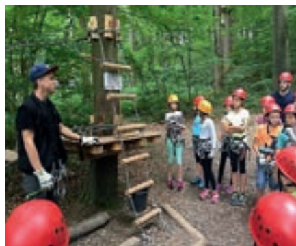
Roland Tibi Bürgermeister