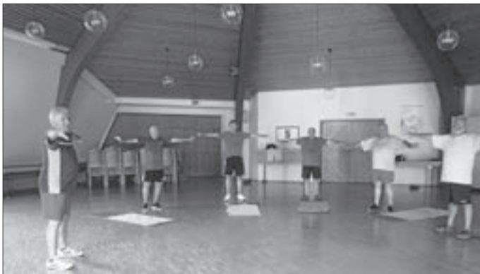
Text und Bild: Edda Hahn