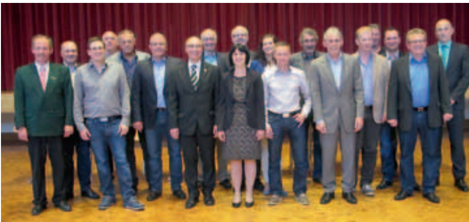
Der neu gewählte Stadtrat stellt sich den Bürgern der Stadt Elzach und der Presse vor.

Am 08.07.2014 begrüßte Bürgermeister Roland Tibi im Haus des Gastes zum ersten Mal den neu konzipierten Gemeinderat. In dieser sehr kurzweiligen Sitzung wurden auch die ausscheidenden Gemeinderäte mit Urkunden und Präsenten verabschiedet. Danach erfolgte die Vereidigung und Verpflichtung des neu gewählten Stadtrates. Im Anschluss gab es einen kleinen Umtrunk für alle geladenen Gäste und interessierten Bürger.