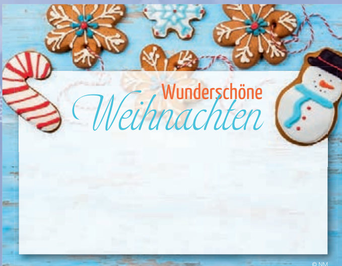
WA18_006: 2-spaltig, 70 mm