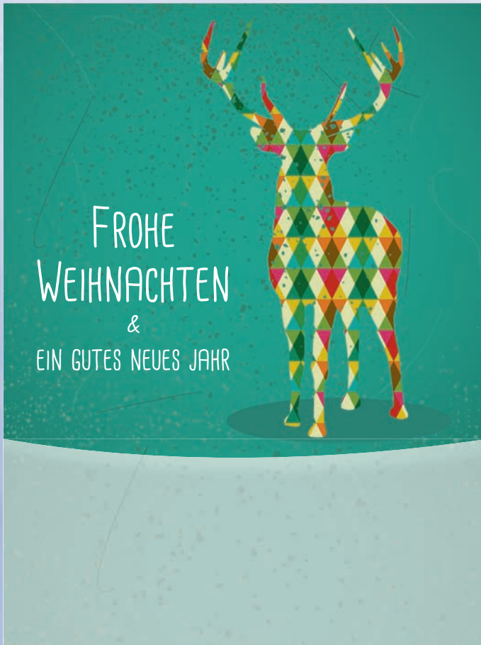
WA18_005: 2-spaltig, 120 mm