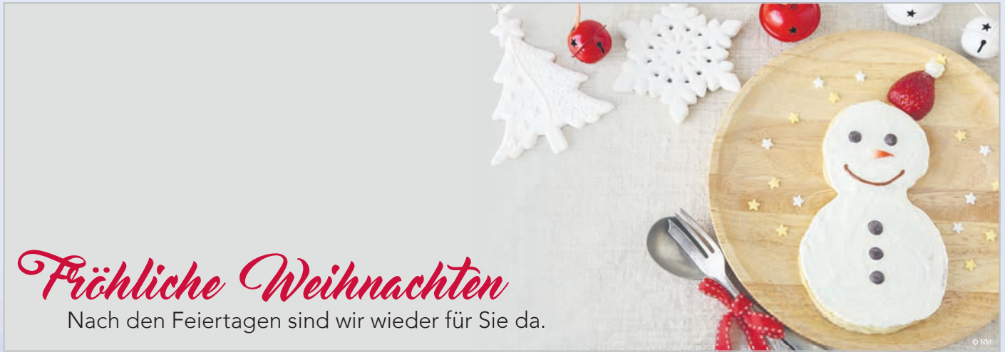
WA18_004: 4-spaltig, 65 mm