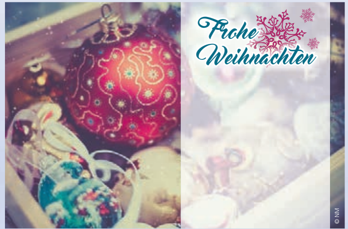
WA18_007: 2-spaltig, 60 mm