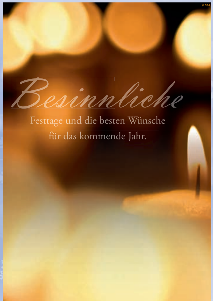
WA18_008: 2-spaltig, 130 mm