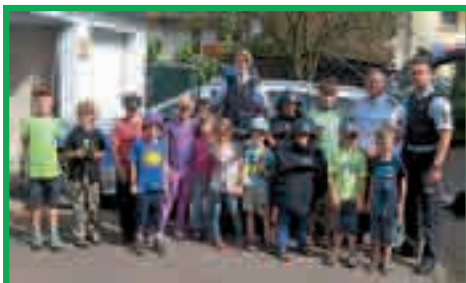
Roland Tibi, Bürgermeister