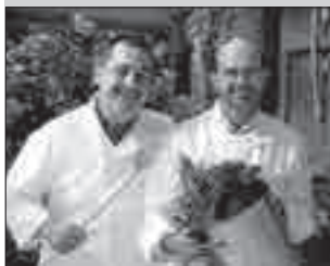
Foto: Clemens Emmler www.zweitaelerland.de ; www.facebook.com/Zweitaelerlandkoeche

Die ZweiTälerLandKöche freuen sich auf Sie!