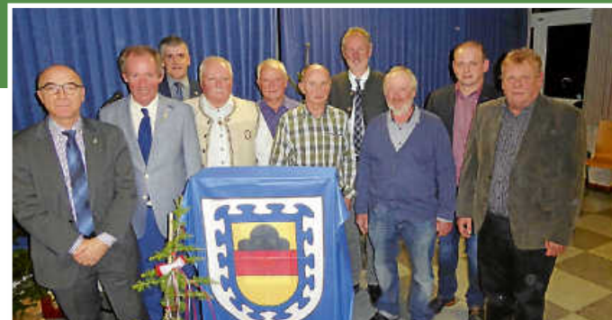
Gäste und Geehrte beim Jubiläumsabend