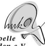
Musikkapelle Oberwinden e.V.

Sehr herzlich laden wir Sie zu unserem Oberwindemer Sommerfestvom 05. bis 07. Juli 2014 in unser gemütliches „Sommerfest-Dorf“ auf dem Bahnhofsplatz ein.