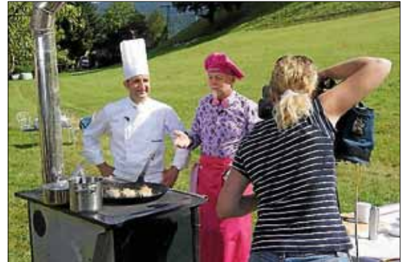
Text und Bild: Roland Gutjahr