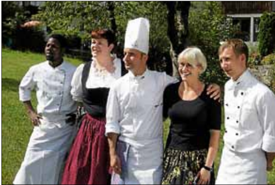
Das Adlerteam bei der Ansage: „a' gueter“ und bei der Aufnahme.

Ausgestrahlt wird die Sendung über „Schäcks-Adler“, Oberprechtals Kirche inklusive Darbietung vom Elzacher Kirchenchor am 04.10.2015 um 10.50 Uhr in France 3.