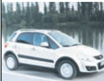
Abb. zeigt Sonderausst.

mit Tageszulassung KW/PS: 88/120 Kraftstoffverbrauch: komb. 6,5–6,2 l/100 km Co 2 Ausstoß: 149–141 g/km Verschiedene Farben erhältlich Solange der Vorrat reicht