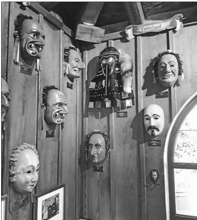
Die Kappe eines Überlinger Hänsele hängt nun auch neben den Larven der anderen Viererbundstädte aus Rottweil, Elzach und Oberndorf im Europapark.