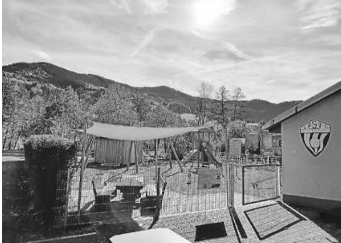
Spielplatz in Oberprechtal

Der Spielplatz beim Sportplatz in Oberprechtal ist öffentlich und auch außerhalb der Spielzeiten der SG POP für spielfreudige Kinder geöffnet!!