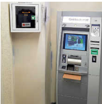
AED im SB-Bereich der Volksbank Elzach

Der AED (Automatisierter Externer Defibrillator) ist nach dem Umbau wieder an seinem Platz.