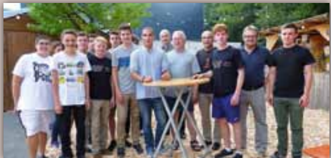
Beim Aufbau mit einigen Vertretern des Jugendhauses und Vertretern der Stadt Elzach

Auf 15 weitere Jahre in guter Zusammenarbeit mit den Elzacher Jugendvertretern, der „Verein für die Jugend Elzach“ e.V.