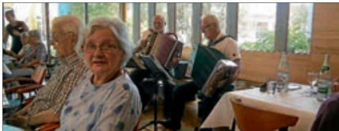
Text und Bild: Edda Hahn

Ab September wieder wie gewohnt unsere wöchentlichen Programme!