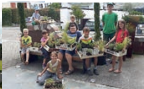
Wir pflanzen einen Kistengarten