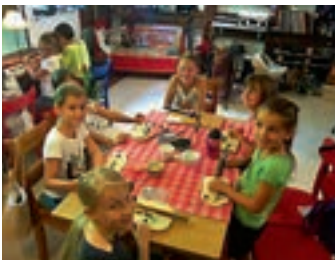
Aus Alltäglichem wird Schmuck

Spiel, Spaß, Spannung, Abenteuer, Wissenswertes, Kreatives und vieles mehr. Seit Beginn der Sommerferien finden bereits viele Aktivitäten statt – sehr zur Freude der Kinder -