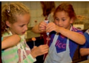
Let's bake Cake pops