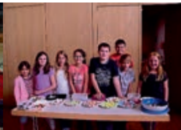
Badepralinen selbst herstellen