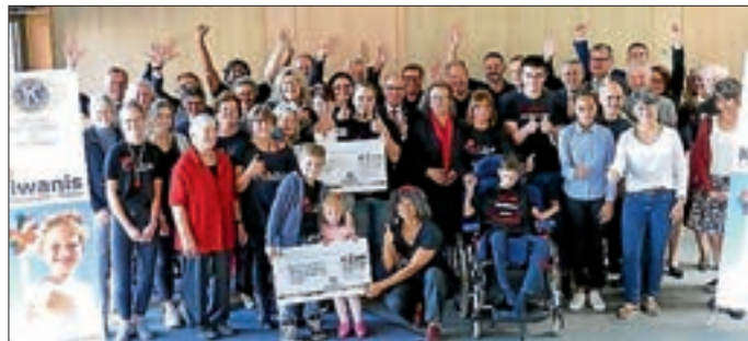
Die Kiwanismitglieder und die Gruppe der Preisträger beim Gemeinschaftsbild

Auf dem Hof der beiden, dem „Fleckli“, werden von behinderten und benachteiligten Kindern, zusammen mit ihren Eltern, Geschwistern und Angehörigen, selbstgehäkelte Mützen, Taschen, Anhänger und Schmuck im Schwarzwaldstil hergestellt. Die gefertigten Produkte werden über Partnergeschäfte, auf Märkten oder im Onlinehandel ( www.gluecksstuebli.de ) vertrieben. Wichtig ist es, den Kindern eine wertschätzende selbstbestimmte Beschäftigung zu ermöglichen. Dazu gehört auch die Arbeit in der Landwirtschaft und der Umgang mit den Tieren auf dem Biolandhof. Weiterer Preisträger war die Kenzinger Gruppe Zarok, deren Hilfe auf die Bedürfnisse von geflüchteten Kindern in der Region des Nordirak ausgerichtet ist.