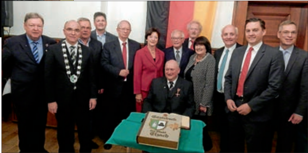
Im Anschluss wurde der Eintrag in das Gästebuch der Stadt Elzach vorgenommen