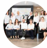
WIDMAIER 71263 Weil der Stadt