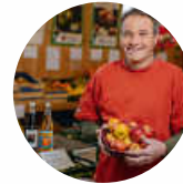
Bauernladen Vöhringer 72406 Bisingen