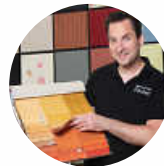
Möbelpolsterei Zacher 71263 Weil der Stadt