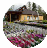
FRANZ FINK Gartengestaltung 75365 Calw