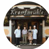
Jägerhof Kropfmühle 72297 Seewald