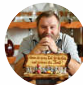
Edelobstbrennerei Wössner 78733 Aichhalden-Rötenberg