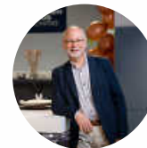
Küchenhaus Schmid 78549 Spaichingen