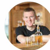
Heckengäu-Brennerei 75391 Gechingen