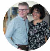
Bühler - Holz und Handwerk 75382 Althengstett