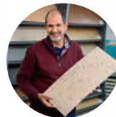
eMka-Fachmarkt für Naturböden 78628 Rottweil-Neufra