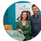
I Dolci Bambini 72144 Dußlingen