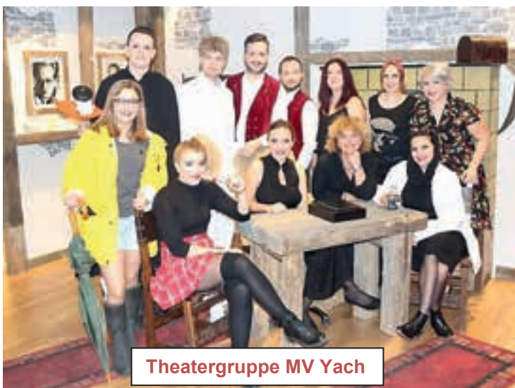
Theatergruppe MV Yach