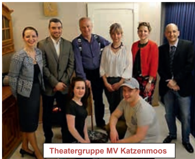
Theatergruppe MV Katzenmoos