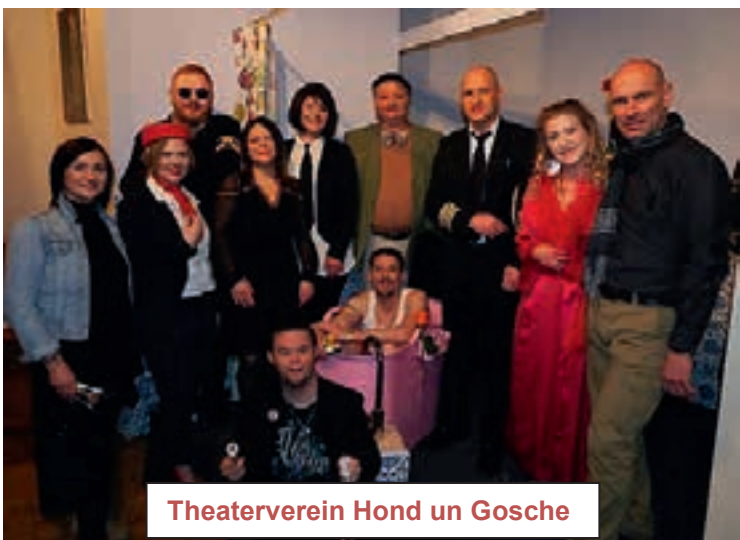
Theaterverein Hond un Gosche