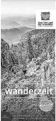
Foto: © ZweiTälerLand Tourismus I neue Broschüre „wanderzeit“ Fotograf: Patrick Kunkel

ZweiTälerLand Elztal & Simonswäldertal im Herzen des Schwarzwaldes