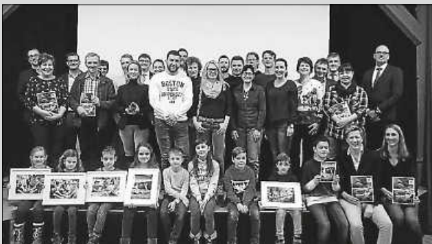
© ZweiTälerLand Tourismus (1) Werben für's ZTL: Sie alle waren am Zustandekommen der neuen Werbeprodukte beteiligt.

Alle neuen Printprodukte liegen ab sofort kostenfrei in der Geschäftsstelle in Bleibach, in den Tourist-Infos Elzach-Oberprechtal, Simonswald und Waldkirch sowie in den Gemeindeverwaltungen aus oder können in digitaler Form heruntergeladen werden unter: https://www.zweitaelerland.de/Media/Prospekte . Auch eine Bestellung per E-Mail oder Telefon ist möglich: info@zweitaelerland.de , Tel. 07685 19433. Der Imagefilm ist unter folgendem Link abrufbar https://www.zweitaelerland.de/Das-ZweiTaelerLand/Aktuelles oder über den YouTube-Kanal von ZweiTälerLand Tourismus.